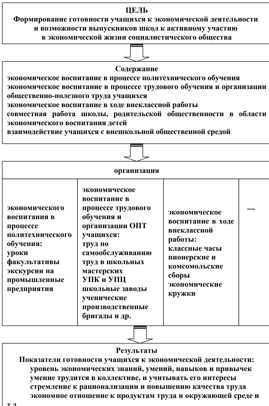
Рис 1. Модель системы экономического воспитания в советской школе